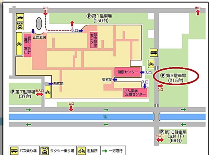
相澤病院 駐車場 拡大図