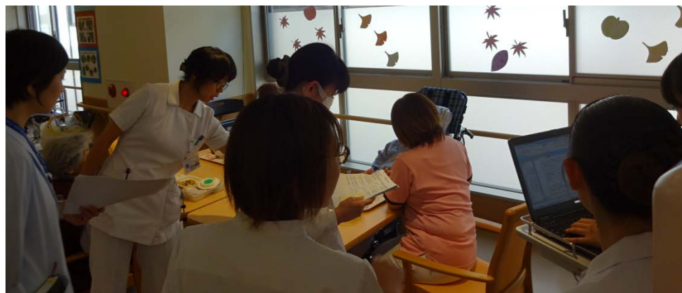
チームメンバーで食事について評価をしている様子

相澤東病院では、食べること、栄養状態に問題を抱える患者さんに対して、様々な専門職でチームをつくり、楽しく安全に食事を摂っていただけるように取り組んでいます。今回はその取り組みの一部を紹介します。